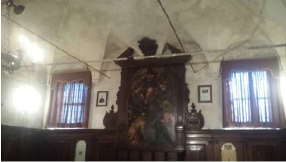
sacristia del Duomo di Candiana volta a botte lunettata opera di Lorenzo da Bologna - anno 1490 ca