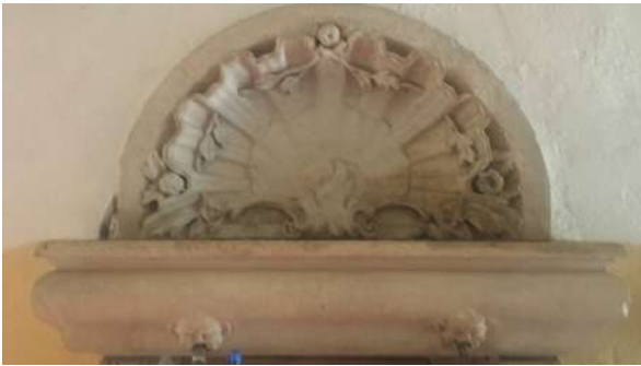
bassorilievo raffigurante una conchiglia opera di Lorenzo da Bologna