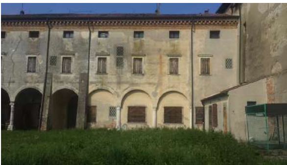
porzione dell'ex monastero candianese con resti dell'antico chiostro con archi su colonne opera dell'architetto Lorenzo da Bologna anno 1470 ca

Le manifestazioni avranno luogo in alcuni locali dell'ex monastero candianese, adiacente al Duomo, Piazza Rubin de Cervin 3